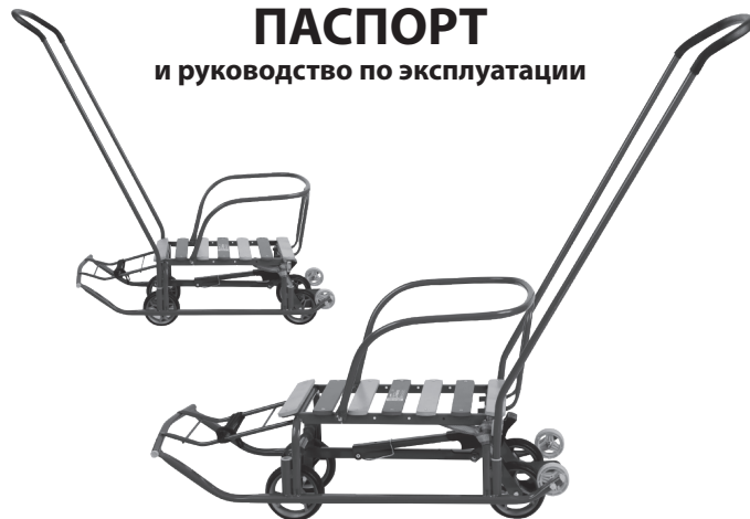
рис. 1 Санки «Тимка 5 универсал» арт. T5Y, Санки «Тимка 5 универсал+» арт. T5Y+

ВНИМАНИЕ! Паспорт следует хранить в течение всего срока службы санок.